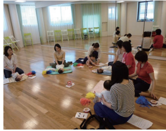
親子ふれあい遊び