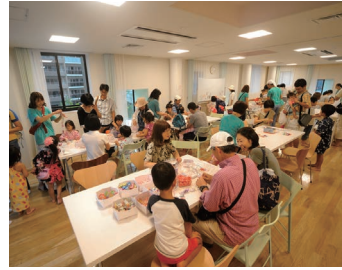
夏祭り ワークショップ